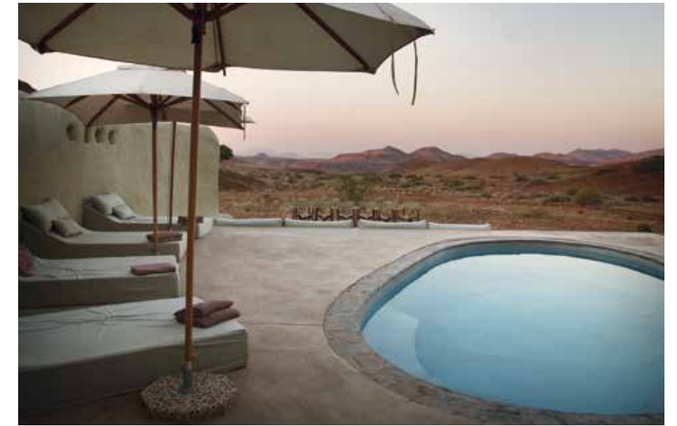
▲ BO MIDT I NATUREN: Damaraland Camp har vunnet en rekke priser for sin økovenlige drift og naturvennlige utforming. Resorten smelter inn i omgivelsene, og trekker naturen inn.